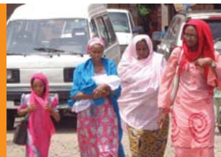
↑ Ženy sú hlavným terčom Boko Haram. Foto: Dušan Ondrušek, Nigéria, 2015

Pôsobiť v oblasti, kde Boko Haram operuje, je pre médiá zložitá. Sú totiž jedným z cieľov.